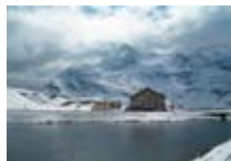
HOTEL Cambrena PASSO BERNINA Passo Bernina CH Tel. 0342/902.424 www.valposchiavo.org