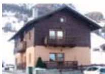
APPARTAMENTI Truzz LIVIGNO Via Saroch, 192c Tel. 0342/970.760 www.livigno.sh