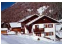
APPARTAMENTI Chalet Bucaneve SANTA CATERINA Via Plagheira, 7 Tel. 0342/925.086 www.valfurva.org