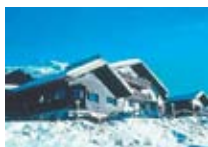
HOTEL *** Alexander LIVIGNO Via Freita, 103 Tel. 0342/996.550 www.livigno.sh