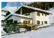
HOTEL ** Del Bosco Garni LIVIGNO Via Teola, 160 Tel. 0342/996.780 www.livigno.sh