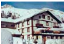
HOTEL Longhin MALOJA Maloja CH Tel. 0342/902.424 www.maloja.biz