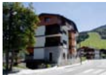
APPARTAMENTI Casa Renzo BORMIO Via Funivia, 11 Tel. 0342/910.381 www.bormio.it/viafunivia