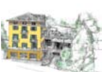
HOTEL *** Sertorelli Reit Meublé BORMIO Via Monte Braulio, 4 Tel. 0342/910.820 www.bormio.it/viamontebraulio