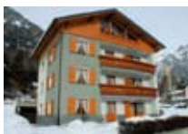
APPARTAMENTI Baita Solaria PREMADIO Via Cancano, 1 Tel. 0342/978.115 www.valdidentro.it