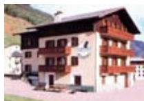
APPARTAMENTI Raethia Residence PEDENOSSO Via Sant Antonio, 1 Tel. 0342/929.624 www.valdidentro.it