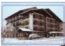
HOTEL *** Derby BORMIO Via Funivia, 15 Tel. 0342/904.433 www.bormio.it/viafunivia