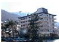
HOTEL *** Park Hotel Bozzi APRICA via Europa, 40 Tel. 0342/902.424 www.aprica.org