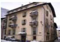
HOTEL ** Dante Meublé BORMIO Via Trieste, 2 Tel. 0342/901.329 www.bormio.it/viatrieste