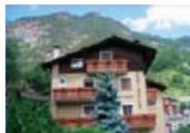
HOTEL*** Genzianella CHIESA IN VALMALENCO via Funivia, 29 Tel. 0342/902.424 www.valmalenco.biz