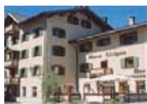
HOTEL *** Livigno LIVIGNO Via Ostaria, 573 Tel. 0342/996.104 www.livigno.sh