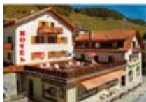
HOTEL*** Alvetern ARDEZ Ardez CH Tel. 0342/902.424 www.ardez.com