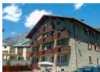
APPARTAMENTI Casa Michela BORMIO Via Santelli, 4 Tel. 0342/901.397 www.bormio.it/viasantelli