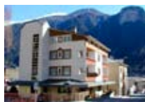
HOTEL ** Rio SONDALO Via Roma, 8 Tel. 0342/801.234 www.sondalo.com