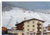
HOTEL *** Garden LIVIGNO Via Crosal, 54 Tel. 0342/970.310 www.livigno.sh