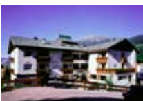
HOTEL **** Sant Anton BORMIO Via Leghe Grigie, 1 Tel. 0342/901.906 www.bormio.it/vialehegrigie