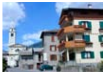
HOTEL *** Franca TOVO Via Roma, 11 Tel. 0342/770.064 www.tovo.biz