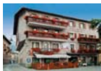
HOTEL *** Sassella GROSIO Via Roma, 2 Tel. 0342/847.272 www.grosio.com