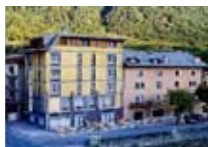
HOTEL ** Stelvio Meublè TIRANO Via Lungo Adda IV Novembre, 1 Tel. 0342/701.044 www.tirano.org