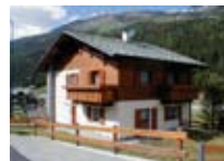
APPARTAMENTI Baita Cola SANTA CATERINA Via Plagheira, 5b Tel. 0342/997.293 www.valfurva.org