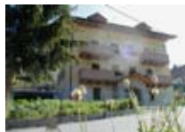
APPARTAMENTI Baita Canton SANTA CATERINA Via Mila, 11 Tel. 0342/945.444 www.valfurva.org