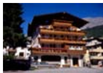
HOTEL *** Contea Garni BORMIO Via Molini, 8 Tel. 0342/901.202 www.bormio.it/viamolini