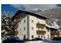
HOTEL ** Giardino BORMIO Via per Piatta, 11 Tel. 0342/903.126 www.bormio.it/viapierpiatta