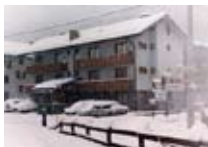
APPARTAMENTI Casa Ables SANT ANTONIO Via Sant Antonio, 4 Tel. 0342/945.758 www.valfurva.org