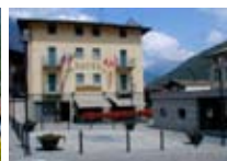
HOTEL *** Le Corti Garni GROSOTTO Via Patrioti, 73 Tel. 0342/848.624 www.grosotto.com