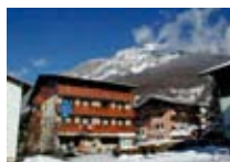
HOTEL *** Olimpia BORMIO Via Funivia, 39 Tel. 0342/901.510 www.bormio.it/viafunivia