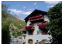
APPARTAMENTI Casa Sablonera BORMIO Via Coltura, 5 Tel. 0342/903.153 www.bormio.it/viacoltura