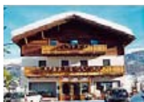
HOTEL *** Nevada LIVIGNO Via Saroch, 35 Tel. 0342/996.551 www.livigno.sh