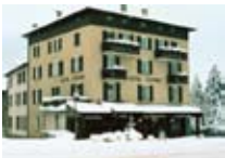
HOTEL *** Capitani BORMIO Via Milano, 23 Tel. 0342/905.300 www.bormio.it/viamilano