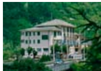
HOTEL *** Valchiosa SERNIO Via Valchiosa, 17 Tel. 0342/701.292 www.sernio.org