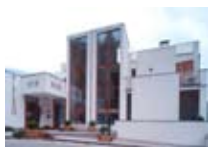
HOTEL ** Rezia SONDALO via Zubiani, 60 Tel. 0342/801.514 www.sondalo.com