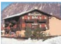
HOTEL *** La Baita LIVIGNO Via Bondi, 98 Tel. 0342/997.070 www.livigno.sh