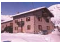
HOTEL Agriturst Gallì LIVIGNO Via Olta, 155a Tel. 0342/996.135 www.livigno.sh