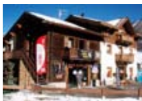
APPARTAMENTI Anna LIVIGNO Via Rasia, 37 Tel. 0342/996.408 www.livigno.sh