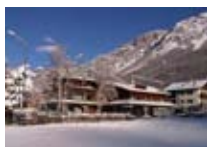
HOTEL *** Nevada BORMIO Via Btg. Morbegno, 21 Tel. 0342/910.888 www.bormio.it/viabtgmborgno