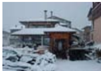
HOTEL *** Ambassador BORMIO Via Funivia, 29 Tel. 0342/904.625 www.bormio.it/viafunivia