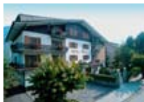
HOTEL*** Chalet Rezia CHIESA IN VALMALENCO via Marconi, 27 Tel. 0342/902.424 www.valmalenco.biz