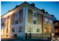
HOTEL*** Chesa Salis BEVER Bever CH Tel. 0342/902.424 www.bever.org