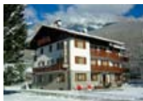
HOTEL *** Cima Bianca Meublé BORMIO Via Credaro, 5 Tel. 0342/910.888 www.bormio.it/viacredaro