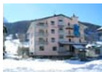
HOTEL *** Larice Bianco APRICA Via Adamello, 38 Tel. 0342/746.275 www.aprica.org