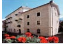
HOTEL *** Margna MORBEGNO Via Margna, 16 Tel. 0342/610.377 www.morbegno.org