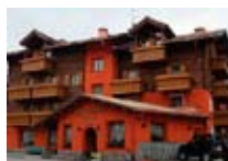
HOTEL *** Cassana LIVIGNO Via Domenion, 214 Tel. 0342/996.565 www.livigno.sh