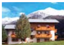
APPARTAMENTI Chalet Ginepro SANTA CATERINA Via Vedich, 6a Tel. 0342/925.036 www.valfurva.org