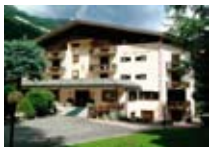
HOTEL*** La Betulla CHIESA IN VALMALENCO via Funivia, 53 Tel. 0342/902.424 www.valmalenco.biz