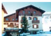
HOTEL *** Le Alpi LIVIGNO Via Saroch, 366f Tel. 0342/996.408 www.livigno.sh