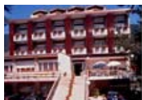
HOTEL *** Cristallo APRICA Via Europa 39/41 Tel. 0342/902.424 www.aprica.org