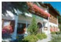
HOTEL*** Engiadina FTAN Ftan CH Tel. 0342/902.424 www.ftan.net