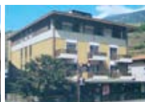
HOTEL *** Schenatti SONDRIO Via Bernina, 7/B Tel. 0342/902.424 www.sondrio.org