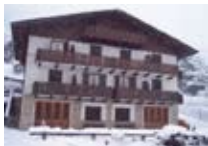
APPARTAMENTI Casa La Fontana 2 PREMADIO Via Cancano, 10 Tel. 0342/929.342 www.valdidentro.it