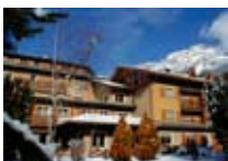
HOTEL *** Sci Sport Residence Meublé BORMIO Via Credaro, 3 Tel. 0342/904.362 www.bormio.it/viacredaro