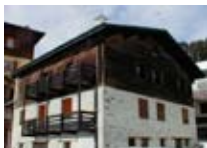
APPARTAMENTI Baita Bonetta SANTA CATERINA Via Forni, 4 Tel. 0342/902.104 www.valfurva.org