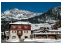
HOTEL ** San Giuseppe CHIESA VALMALENCO Località San Giuseppe Tel. 0342/452.030 www.valmalenco.biz