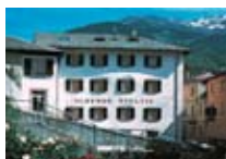
HOTEL *** Stelvio BORMIO Via della Vittoria, 36 Tel. 0342/910.130 www.bormio.it/viadellavittoria