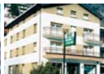
HOTEL ** Meublè Stelvio APRICA Corso Roma, 181 Tel. 0342/748.996 www.aprica.org