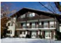
HOTEL *** La Baitina Meublé BORMIO Via Peccedi, 26 Tel. 0342/903.022 www.bormio.it/viapeccedi