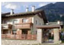
APPARTAMENTI Residenza Terme PREMADIO Via Adda, 2 Tel. 0342/918.161 www.valdidentro.it