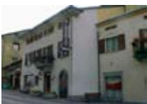
HOTEL *** Silene BORMIO Via Roma, 121 Tel. 0342/905.455 www.viaroma.bormio.it