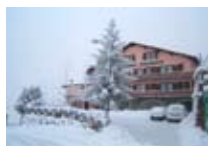
HOTEL ** Miravalle TEGLIO Via Roma, 70 Tel. 0342/780.154 www.teglio.net