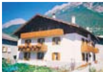
APPARTAMENTI Casa Gisella PREMADIO Via Alle Fornaci, 3 Tel. 0342/929.298 www.valdidentro.it