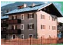
APPARTAMENTI Casa Lucia BORMIO Via Molini, 11 Tel. 0342/904.433 www.bormio.it/viamolini