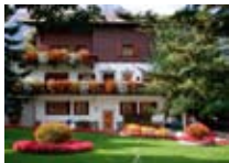
APPARTAMENTI Chalet Tania BORMIO Via Funivia, 4 Tel. 0342/945.237 www.bormio.it/viafunivia