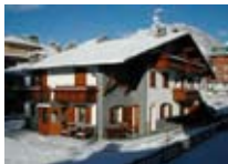
APPARTAMENTI Chalet Gardenia BORMIO Via Santa Barbara, 29a Tel. 0342/901.346 www.bormio.it/viasantabarbara