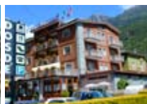
HOTEL * Dosdè Motel GROSIO Via Milano, 105 Tel. 0342/847.380 www.grosio.com