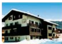
APPARTAMENTI Casa Faifer LIVIGNO Via Crosal, 57 Tel. 0342/978.115 www.livigno.sh