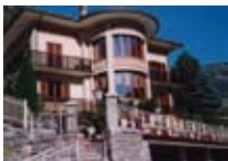
HOTEL*** Mirage LANZADA via Ronchetti, 331 Tel. 0342/453.175 www.valmalenco.biz