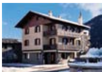
APPARTAMENTI Casa Viola ISOLACCIA Piazza IV Novembre, 16 Tel. 0342/921.113 www.valdidentro.it