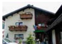
HOTEL *** Francesin Garni LIVIGNO Via Ostaria, 442 Tel. 0342/970.320 www.livigno.sh