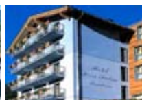
HOTEL **** Residence Pizzo Scalino CHIESA IN VALMALENCO via Bernina, 107 Tel. 0342/902.424 www.valmalenco.biz