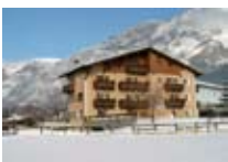
HOTEL *** Alpi & Golf BORMIO Via Milano, 78 Tel. 0342/901.341 www.bormio.it/viamilano