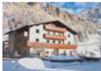
APPARTAMENTI Casa Martinelli ISOLACCIA Via Capole, 12 Tel. 0342/985.878 www.valdidentro.it