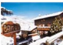
HOTEL ** Baita Cusini LIVIGNO Via SS301, 978 Tel. 0342/970.363 www.livigno.sh