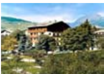
HOTEL *** Nazionale BORMIO Via Al Forte, 28 Tel. 0342/903.361 www.bormio.it/viaalforte