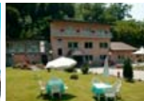
HOTEL *** Piccolo Mondo TIRANO Via Porta Milanese, 81 Tel. 0342/701.489 www.tirano.org