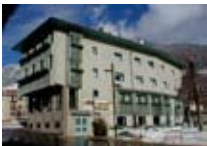
HOTEL *** Cervo BORMIO Via Peccedi, 7 Tel. 0342/904.744 www.bormio.it/viapeccedi