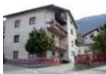
HOTEL Stazzona B&B VILLA DI TIRANO Via Gianbonelli, 10 Tel. 0342/795.538 www.villaditirano.com