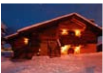
APPARTAMENTI Chalet Garden LIVIGNO Via SS301, 708 Tel. 0342/970.310 www.livigno.sh