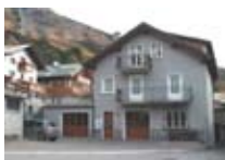
APPARTAMENTI Casa Cola PREMADIO Via Ripa Fontana, 3 Tel. 0342/997.428 www.valdidentro.it