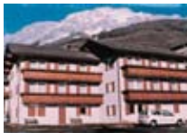
APPARTAMENTI Casa Stefano BORMIO Via Molini, 11 Tel. 0342/904.433 www.bormio.it/viamolini