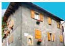
APPARTAMENTI Casa Fumagalli BORMIO Via Monte Grappa, 2 Tel. 0342/902.417 www.bormio.it/viamontegrappa