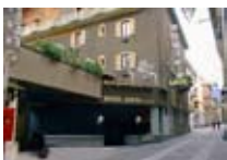
HOTEL **** Posta BORMIO Via Roma, 66 Tel. 0342/904.753 www.viaroma.bormio.it