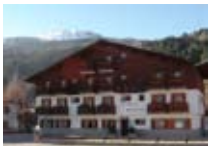
HOTEL *** Bormio Meublé BORMIO Via Milano, 88 Tel. 0342/905.092 www.bormio.it/viamilano