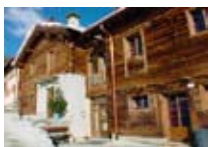
APPARTAMENTI Bait La Broina LIVIGNO Via Florin, 24 Tel. 0342/970.218 www.livigno.sh