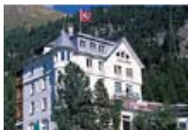
HOTEL**** La Collina PONTRESINA Pontresina CH Tel. 0342/902.424 www.pontresina.org