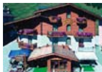
HOTEL *** Helvetia LIVIGNO Via Plan, 415 Tel. 0342/970.066 www.livigno.sh