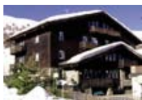
HOTEL ** Nuova Villa Residence LIVIGNO Via Saroch, 782c Tel. 0342/990.100 www.livigno.sh