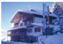
HOTEL *** Pineta VAL GEROLA Piana di Fienile, 5 Tel. 0342/690.180 www.morbegno.org