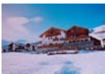
HOTEL *** Steinbock LIVIGNO Via Rin, 127 Tel. 0342/970.520 www.livigno.sh