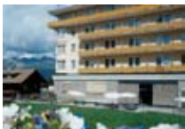
HOTEL**** Schweizerhof PONTRESINA Pontresina CH Tel. 0342/902.424 www.pontresina.org