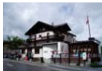
HOTEL** Sporthotel MALOJA Maloja CH Tel. 0342/902.424 www.maloja.biz