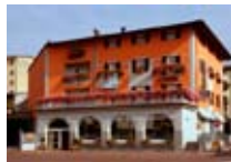
HOTEL *** Bernina TIRANO Via Roma, 24 Tel. 0342/701.302 www.tirano.org