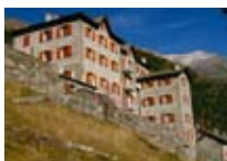
APPARTAMENTI Daniela CHIAREGGIO Loc. Chiesa Valmalenco Tel. 0342/210.845 www.valmalenco.biz

Inserisci anche la tua struttura in questa Guida Illustrata! Chiama 0342 902424