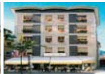
HOTEL *** Corona TIRANO viale Italia, 19 Tel. 0342/902.424 www.tirano.org