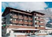
HOTEL **** Baita dei Pini BORMIO Via Peccedi, 15 Tel. 0342/904.346 www.bormio.it/viapeccedi