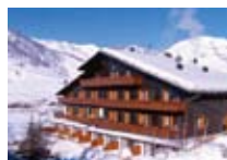
HOTEL *** Bucaneve LIVIGNO Via SS301, 194 Tel. 0342/996.201 www.livigno.sh