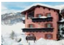
APPARTAMENTI Astra LIVIGNO Via Rin, 303 Tel. 0342/997.428 www.livigno.sh