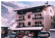
HOTEL*** La Lanterna CHIESA IN VALMALENCO via Bernina, 88 Tel. 0342/451.438 www.valmalenco.biz