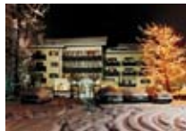
HOTEL *** Baita Clementi Residence BORMIO Via Milano, 46 Tel. 0342/904.473 www.bormio.it/viamilano