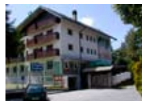
HOTEL *** Biancaneve Residence APRICA Via Italia, 33 Tel. 0342/746.521 www.aprica.org