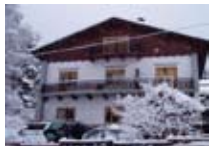
APPARTAMENTI Casa La Fontana PREMADIO Via Cancano, 2 Tel. 0342/929.342 www.valdidentro.it