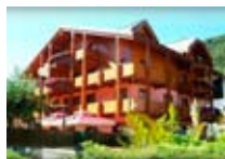
HOTEL **** Arisch APRICA Via Privata Gemelli Tel. 0342/746.048 www.aprica.org