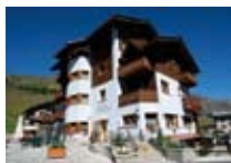
HOTEL *** Cristallo LIVIGNO Via Rin, 232 Tel. 0342/996.177 www.livigno.sh