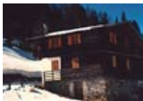
APPARTAMENTI Baita del Papi SANTA CATERINA Via Vedich, 104 Tel. 0342/945.506 www.valfurva.org