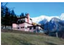
HOTEL *** Torre SONDALO Via Zubiani, 78 Tel. 0342/801.131 www.sondalo.com