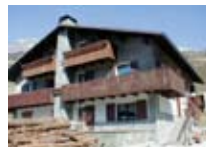
APPARTAMENTI Casa Quattro Stagioni SANT ANTONIO Via Coltura, 1b Tel. 0342/945.054 www.valfurva.org