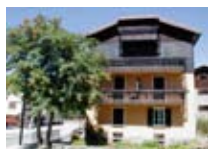
APPARTAMENTI Casa Elda BORMIO Via Funivia, 9 Tel. 0342/910.381 www.bormio.it/viafunivia