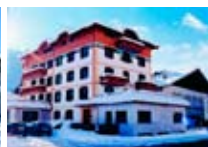
HOTEL *** Posta APRICA Corso Roma, 16 Tel. 0342/902.424 www.aprica.org