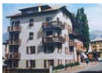
APPARTAMENTI Casa Compagnoni BORMIO Via Peccedi, 8 Tel. 0342/910.195 www.bormio.it/viapeccedi