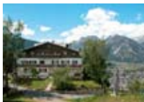
APPARTAMENTI Lo Chalet CIUK Ciuk Tel. 0342/904.381 www.valdisotto.com