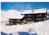
HOTEL *** Margherita LIVIGNO Via Teola, 65 Tel. 0342/996.153 www.livigno.sh