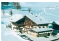
HOTEL *** Sport Hotel LIVIGNO Via Palipert, 78 Tel. 0342/979.300 www.livigno.sh