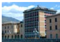
HOTEL *** Europa SONDRIO Via Lungo Mallero Cadorna, 27 Tel. 0342/515.010 www.sondrio.org