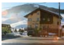
HOTEL *** La Suisse LIVIGNO Via Olta, 245 Tel. 0342/970847 www.livigno.sh