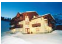
HOTEL *** Costanza Garni LIVIGNO Via Domenion, 129a Tel. 0342/978.115 www.livigno.sh