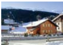
APPARTAMENTI Baita del Sole SANTA CATERINA Via Forni, 14 Tel. 0342/935.549 www.valfurva.org