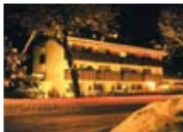
APPARTAMENTI Elga Residence PIAZZA Via Nazionale, 31a Tel. 0342/951.138 www.valdisotto.com