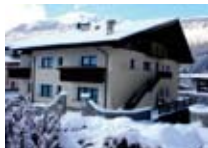
APPARTAMENTI Chalet Alberti BORMIO Via Leghe Grigie, 9c Tel. 0342/905.377 www.bormio.it/vialehegrigie