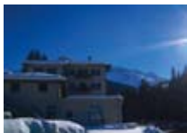
APPARTAMENTI Appartamento Joy SANTA CATERINA Via Santa Caterina, 4 Tel. 0342/935.237 www.valfurva.org