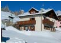
APPARTAMENTI Baita Soliva OGA Via Crap del Maro Tel. 0342/929.190 www.valdisotto.com