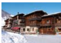
HOTEL *** La Montanina LIVIGNO Via Pienz, 12 Tel. 0342/996.060 www.livigno.sh