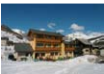
HOTEL *** Valtellina LIVIGNO Via Saroch, 350 Tel. 0342/996.781 www.livigno.sh