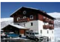
HOTEL *** La Colombina TREPALLE Trepalle Tel. 0342/979.908 www.trepalle.it