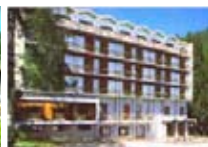
HOTEL *** Club Hotel Antares APRICA via Pineta, 2 Tel. 0342/902.424 www.aprica.org