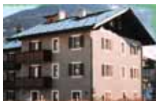
APPARTAMENTI Casa Stefano BORMIO Via Molini, 11 Tel. (+39) 0342 904 433