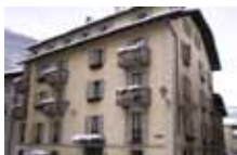
HOTEL ★★ Dante Meublè BORMIO Via Trieste, 2 Tel. (+39) 0342 901 329