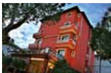
HOTEL *** Sorriso RIMINI Viale Trento, 7 Tel. (+39) 0541 709.555