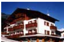
HOTEL ★★★ Iris Residence Meublè CEPINA Via Funivia, 63/a Tel. (+39) 0342 950 439