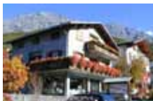
ARREDAMENTO Idealcasa BORMIO Via Sant Antonio, 16 Tel. (+39) 0342 901 240