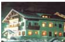
HOTEL ★★ Gardenia ISOLACCIA Via Ai Piani, 6 Tel. (+39) 0342 985 563