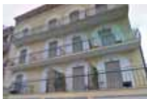
HOTEL *** Villa Elisa RIMINI Via Giovanni Pascoli, 127 Tel. (+39) 0541 381.240