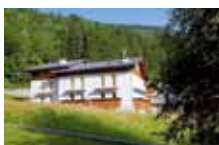
APPARTAMENTI Chalet del Bosco VALDISOTTO Via Canton/Valle del Pretetel Tel. (+39) 338 87 65 245