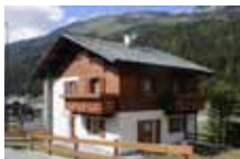
APPARTAMENTI Baita Cola SANTA CATERINA Via Plagheira, 5b Tel. (+39) 0342 997 293