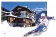
HOTEL **** Baita Fiorita SANTA CATERINA Via Frodolfo, 3 Tel. (+39) 0342 902.424