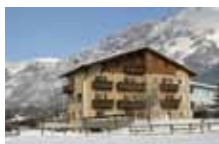
HOTEL *** Alpi & Golf BORMIO Via Milano, 78 Tel. (+39) 0342 901 341