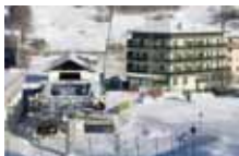
HOTEL ★★★ Hotel Club Funivia APRICA P.le Funivia Baradello Tel. (+39) 0342 902 424