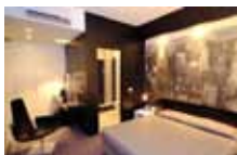
SUITES Le suites di Tirano TIRANO Viale Italia Tel. (+39) 0342 902 424