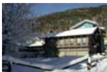
HOTEL ★★★ Saint Martin APRICA Via Europa, 18 Tel. (+39) 0342 902 424