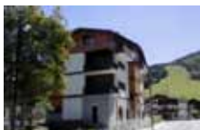
APPARTAMENTI Casa Renzo BORMIO Via Funivia, 11 Tel. (+39) 0342 910 381