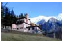
HOTEL ★★★ Torre SONDALO Via Zubiani, 78 Tel. (+39) 0342 801 131