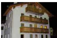
APPARTAMENTI Casa Betty BORMIO Via Funivia, 63/a Tel. (+39) 338 16 76 808