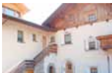
APPARTAMENTI Casa Caste BORMIO Btg. Tirano, 3/c Tel. (+39) 0342 911 384