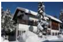
HOTEL ★★★ Engiadina FTAN Tel. (+39) 0342 902 424