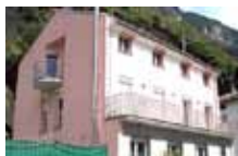
BED & BREAKFAST B&B Paradiso GROSIO via Rovaschiera, 48 Tel. (+39) 0342 902 424