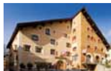
HOTEL ★★★ Klarer ZUOZ Tel. +41 (0)81 851 34 34