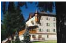
HOTEL ★★★ Li Arnoga ARNOGA Via SS 301 Tel. (+39) 0342 927 116