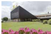
HOTEL *** Mancin TAGLIO DI PO' S.S.Romea, 309 Tel. (+39) +39 0426 662.355