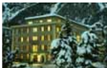
HOTEL ★★★ Bernina PONTRESINA Tel. +41 (0)81 838 86 86