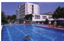
HOTEL *** Alexander ROSOLINA MARE Viale dei Pini, 60 Tel. (+39) 0426 680.47