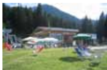
RISTORO Paso APRICA Loc. Palabione Tel. (+39) 0342 745 065