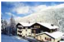
HOTEL ** Baita Sciatori SANTA CATERINA Via Meralda, 6 Tel. (+39) 0342 925 111