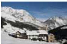
HOTEL ★★★ Cardo SEMOGO Via Cima Piazzì, 80 Tel. (+39) 0342 927 171