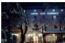
HOTEL ★★★ Combolo TEGLIO Via Roma, 5 Tel. (+39) 0342 902 424