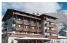
HOTEL **** Baita dei Pini BORMIO Via Peccedi, 15 Tel. (+39) 0342 904 346