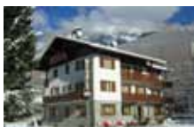
HOTEL ★★★ Cima Bianca Meublè BORMIO Via Credaro, 5 Tel. (+39) 0342 901 449