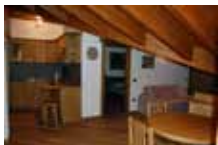
FALEGNAME Mobil Art BORMIO Via Sertorelli, 64 Tel. (+39) 0342 927 318