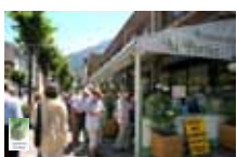
RISTORANTE Ai Portici TIRANO Via Italia, 87 Tel. (+39) 0342 701 255