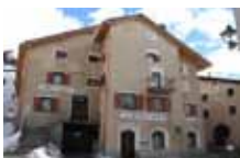
HOTEL ★★ Pensione Croce Bianca SAMEDAN Tel. +41 (0)81 852 53 53