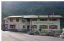
AGRITURISMO RISTORO Moon Café GROSIO TIOLE Via Stelvio, 152 Tel. (+39) 0342 803 215