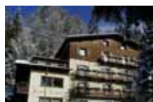
HOTEL ** Daniela BORMIO Via Monte Cristallo, 21 Tel. (+39) 0342 904 572