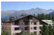
HOTEL ★★★★★ Cervus ST. MORITZ Tel. 0041 (0)81 38 50 000