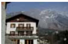
HOTEL ★★ Alpina PREMADIO Via San Gallo, 1 Tel. (+39) 0342 901 251