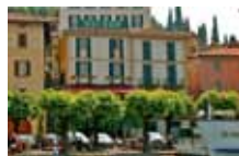
HOTEL * Suisse BELLAGIO Piazza Mazzini 8 Tel. (+39) 031 951755