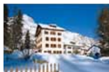
HOTEL ★★★ Privata SILS Tel. 0041 (0)81 83 26 200