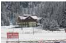
HOTEL *** Cevedale SANTA CATERINA Via Magliaga, 15 Tel. (+39) 0342 935.564