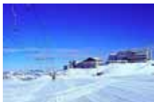
HOTEL *** Livrio PASSO STELVIO Passo Stelvio (piste) Tel. (+39) 0342 904.050