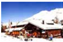
HOTEL ** Paradiso SANTA CATERINA Località Plagheira Tel. (+39) 0342 935 417