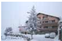
HOTEL ★★ Miravalle TEGLIO Via Roma, 70 Tel. (+39) 0342 902 424