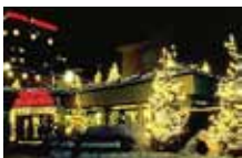
HOTEL ★★★★★ Europa ST. MORITZ Tel. +41 (0)81 839 55 55