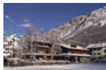
HOTEL *** Nevada BORMIO Via Btg. Morbegno, 21 Tel. (+39) 0342 910.888