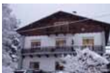
APPARTAMENTI Casa La Fontana PREMADIO Via Cancano, 2 Tel. (+39) 0342 929 342