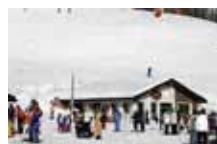
NOLEGGIO E RIPARAZIONE Noleggio Max LIVIGNO via Plan, 413 Tel. (+39) 0342 970 130