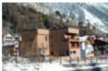
HOTEL ★★★ La Val ISOLACCIA Via Presura, 7 Tel. (+39) 0342 985 519