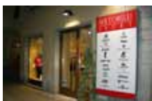
ARTICOLI SPORTIVI bimbi Sertorelli Sport BORMIO Via Roma, 51 Tel. (+39) 0342 903 060