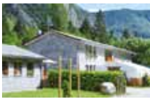
CAMPEGGIO *** Campeggio Sasso Remenno VAL MASINO Loc. Sasso Remenno