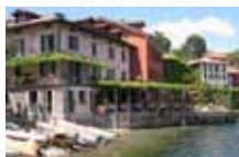
HOTEL ** La Pergola BELLAGIO Piazza del Porto 4 Tel. (+39) 031 950263