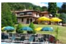
HOTEL *** Royal MENAGGIO L.go V. Veneto 91 Tel. (+39) 0344 31444