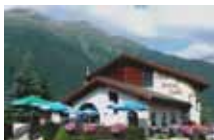
HOTEL PIZZERIA Selva ZERNEZ Tel. +41 (0)81 856 12 85