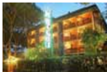
HOTEL *** Bijou FORTE DEI MARMI Via Salvatore Allende 31 Tel. (+39) 0584 787181