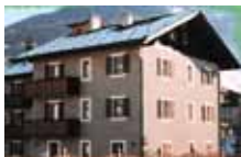
APPARTAMENTI Casa Lucia BORMIO Via Molini, 11 Tel. (+39) 0342 904 433