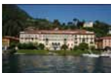
GRAND HOTEL ***** Menaggio MENAGGIO Via 4 Novembre 77 Tel. (+39) 0344 30640