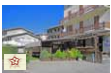
RISTORANTE PIZZERIA Al Castello Teglio Via Besta, 10 Tel. (+39) 0342 780 305