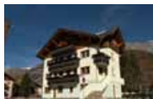
APPARTAMENTI Residence Pedranzini BORMIO Via Campioni Olimpici Tel. (+39) 339 11 02 533