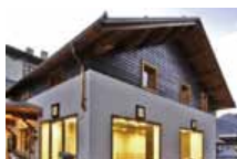
ABBIGLIAMENTO Renna Sport Bags LIVIGNO Via Bondi, 29 Tel. (+39) 0342 990 151