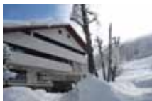
HOTEL ★★★ Cioccarelli APRICA Via Adamello, 10 Tel. (+39) 0342 902 424