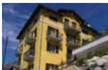
HOTEL ★★★ Sertorelli Reit Meublè BORMIO Via Monte Braulio, 4 Tel. (+39) 0342 902 424