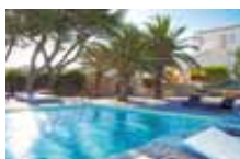
HOTEL **** L'Approdo s.MARIA DI LEUCA Via Panoramica, 1 Tel. (+39) 0833 758.548