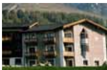
HOTEL Miragolf Residence MADULAIN Tel. +41 (0)81 851 21 71