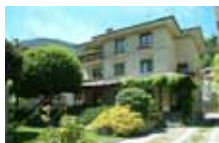
BED & BREAKFAST B&B Villa Verde GROSIO via Pineta, 2 Tel. (+39) 0342 902 424