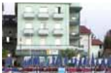
HOTEL *** Rio BELLARIA IGEA MARINA Lung. Cristoforo Colombo, 8 Tel. (+39) 0541 344.492