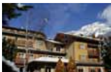
HOTEL ★★★ Sci Sport Residence Meublè BORMIO Via Credaro, 3 Tel. (+39) 0342 904 362