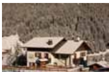
APPARTAMENTI Chalet Bucaneve SANTA CATERINA Via Plagheira, 7 Tel. (+39) 0342 925 086