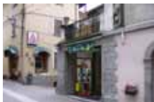
ABB. BIMBI - PUERICULTURA Peter Pan BORMIO Via Roma, 55 Tel. (+39) 0342 911 084