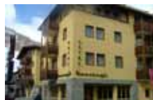
HOTEL ★★★★★ Touring LIVIGNO Via Plan, 117 Tel. (+39) 0342 996 131