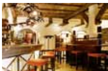
RIFUGIO-RISTORO Gallo Cedrone VALDISOTTO Loc. Bormio 2000 Tel. (+39) 0342 902 317