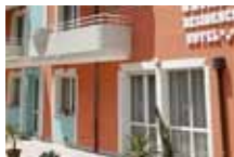
APPARTAMENTI Olimpo RIMINI Via Pola, 3 Tel. (+39) 0541 552.42