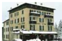
HOTEL *** Capitani BORMIO Via Milano, 23 Tel. (+39) 0342 905.300