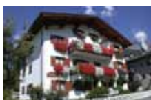
APPARTAMENTI Baita Diana BORMIO Via Sant Antonio, 12 Tel. (+39) 0342 903 793