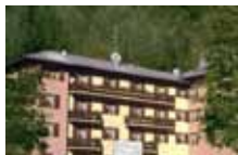
APPARTAMENTI Stella Alpina APRICA Corso Roma, 3 Tel. (+39) 0342 902 424