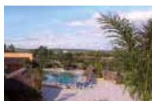
VILLAGGIO TUR. **** Punta Grossa TORRE LAPILLO Torre Colimena Tel. (+39) 0833 855.903