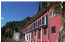
HOTEL *** Eremo Gaudio VARENNA Via Roma, 25 Tel. (+39) 0341 815.301