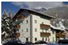
HOTEL ** Giardino BORMIO Via per Piatta, 11 Tel. (+39) 0342 903 126