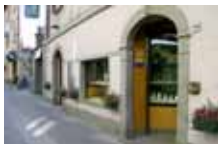
GIOIELLERIA Valentino BORMIO Via Roma, 59 Tel. (+39) 0342 901 380