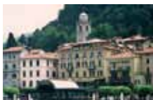
HOTEL *** Du Lac BELLAGIO Piazza Mazzini 32 Tel. (+39) 031 950320