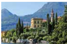
BED & BREAKFAST Il Bolentino VARENNA Via Venini, 156 Tel. (+39) 347 74.53.559