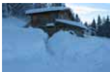
AGRITURISMO I Conti di Piscè VILLA DI TIRANO Loc. Pian di Gembro Tel. (+39) 0342 746 518