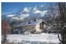
HOTEL ★★★ Chesa Grischa SILS Tel. +41 (0)81 826 51 16