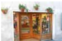
CALZATURE Giacomelli BORMIO Via Moltrasio, 1 Tel. (+39) 0342 903 566