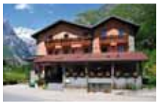
HOTEL *** Miramonti VAL MASINO Via Zocca, 12 Tel. (+39) 0342 64 01 44