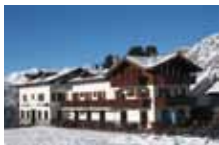
HOTEL *** Cedrone BORMIO 2000 Bormio 2000 Tel. (+39) 0342 902.317