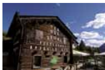
RISTORANTE Tea del Vidal LIVIGNO Via Bondi, 59 Tel. (+39) 0342 996 129