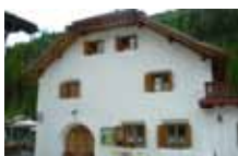
HOTEL ★★★ Crusch Alba ed Alvetern SCUOL S-CHARL Tel. 0041 (0)81 86 41 405