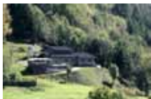
AGRITURISMO Li Spondi APRICA Loc. Li Spondi Tel. (+39) 339 19 24 482