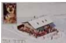
RIFUGIO - RISTORO Palù SANTA CATERINA Località Plagheira Tel. (+39) 0342 925 030