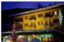
HOTEL *** Sport SANTA CATERINA Via Magliaga, 2 Tel. (+39) 0342 925 100