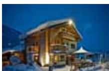
HOTEL ★★★ Alegra LIVIGNO Via Saroch, 1274b Tel. (+39) 0342 996 134