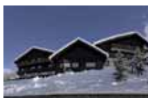
HOTEL ★★★ Alexander LIVIGNO Via Freita, 103 Tel. (+39) 0342 996 550