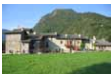
AGRITURISMO Le Case dei Baff ARDENNO MASINO Via Mulini, 19 Tel. (+39) 0342 661 045