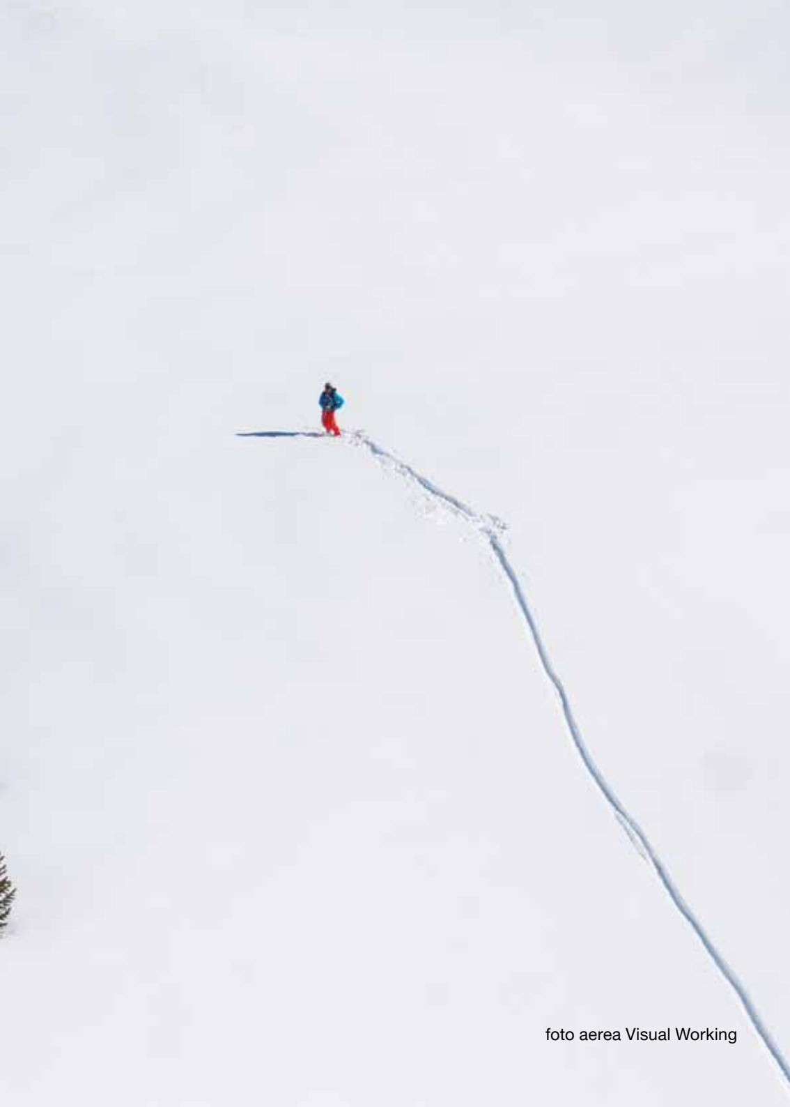
foto aerea