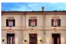
HOTEL★★★ Altavilla TIRANO Piazza Basilica