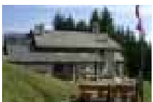
RIFUGIO Rifugio della Corte VALGEROLA Loc. La Corte Tel. (+39) 338 846 3479