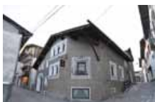
APPARTAMENTI Chalet Cotril BORMIO Via Dante, 6 Tel. (+39) 335 35 53 68