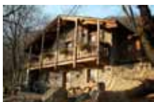
AGRITURISMO La Nughera CIVO Frazione Cadelsasso Tel. (+39) 347 15 67 054