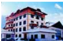
HOTEL ★★★ Posta APRICA Corso Roma, 16 Tel. (+39) 0342 902 424