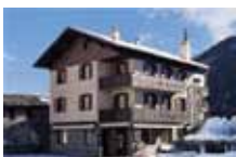
APPARTAMENTI Casa Viola ISOLACCIA Piazza IV Novembre, 16 Tel. (+39) 0342 921 113