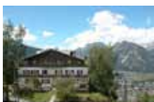
APPARTAMENTI Lo Chalet CIUK Ciuk Tel. (+39) 0342 902 424