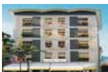
HOTEL ★★★ Corona TIRANO viale Italia, 19