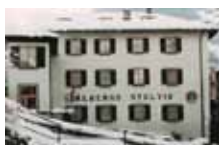
HOTEL **** Stelvio BORMIO Via della Vittoria, 36 Tel. (+39) 0342 910.130