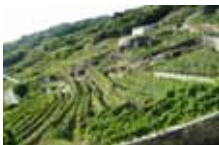
CASA VINICOLA Nera CHIURO Via IV Novembre, 43 Tel. (+39) 0342 482 631