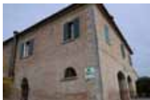
AGRITURISMO Duslaun VILLA VERRUCCHIO Via Serra, 1224 Tel. (+39) 0541 679.147