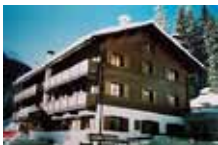
APPARTAMENTI Valfurva Residence SANTA CATERINA Via Magliaga, 44 Tel. (+39) 0342 935 500