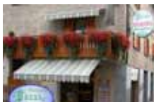
PASTICCERIA Pozzi Pasticceria BORMIO Via IV Novembre, 4 Tel. (+39) 0342 901 492