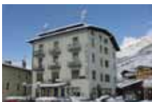
HOTEL * Zebraù SANT ANTONIO Via Gleira, 15 Tel. (+39) 0342 946 025