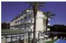
HOTEL **** Grand Hotel FORTE DEI MARMI Via Giorgini 1 Tel. (+39) 0584 787.431