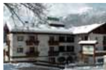
HOTEL **** Sant Anton BORMIO Via Leghe Grigie, 1 Tel. (+39) 0342 902 424