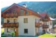
APPARTAMENTI Chalet La Rugiada VALDISOTTO Via Roma, 82/b Tel. (+39) 0342 951 151