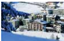
HOTEL ★★★ Miravalle SEMOGO Piazza Sant Abbondio, 3 Tel. (+39) 0342 985 264