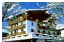
HOTEL *** Nazionale BORMIO Via Al Forte, 28 Tel. (+39) 0342 902.424