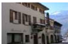
HOTEL **** Silene BORMIO Via Roma, 121 Tel. (+39) 0342 905.455