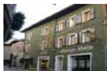
HOTEL **** Stella BORMIO via Roma, 101 Tel. (+39) 0342 910 397