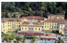
GRAND HOTEL ***** Villa Serbelloni BELLAGIO Via Roma 1 Tel. (+39) 031 950216