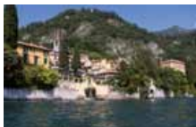
HOTEL **** Royal Hotel Victoria VARENNA Piazza San Giorgio, 2 Tel. (+39) 0341 815.111