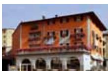
HOTEL ★★★ Bernina TIRANO Via Roma, 24