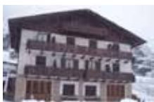
APPARTAMENTI Casa La Fontana 2 PREMADIO Via Cancano, 10 Tel. (+39) 0342 929 342