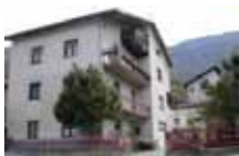
BED & BREAKFAST Stazzona B&B VILLA DI TIRANO Via Gianbonelli, 10 Tel. (+39) 0342 902 424