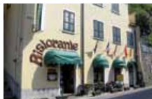
HOTEL *** Montecodeno VARENNA Via della Croce, 2 Tel. (+39) 0341 830.123