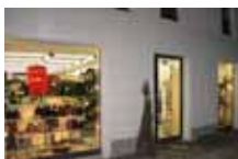
PROFUMERIA Soleil BORMIO Via Roma, 10 Tel. (+39) 0342 903 328