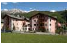
HOTEL ★★★ Garni Belvair ZUOZ Tel. +41 (0)81 85 42 023