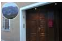
APPARTAMENTO Valentina BORMIO via Molini Tel. (+39) 0342 902 424