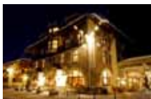
HOTEL ★★★ Villa Post TARASP VULPERA Tel. (+39) 0342 902 424