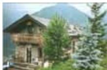
AGRITURISMO Baita del Gufo GROSOTTO Via Mortirolo, 16 Tel. (+39) 0342 986 134