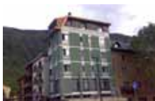
MEUBLE' ★★★ Stelvio TIRANO Lungo Adda IV Novembre, 1 Tel. (+39) 0342 902 424