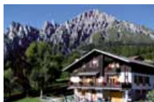
BED & BREAKFAST Ai Frassini ABBADIA LARIANA Via dei Frassini, 9 Tel. (+39) 0341 590.022