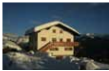
TRATTORIA RISTORO Cascina Biancotti VILLA DI TIRANO Loc. Pian di Gembro Tel. (+39) 0342 747 061