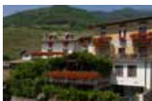
HOTEL ★ Locanda Altavilla BIANZONE Via Ai Monti, 46 Tel. (+39) 0342 902 424