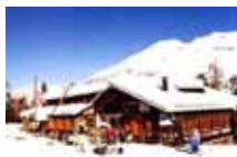
RIFUGIO - RISTORO Paradiso SANTA CATERINA Località Plagheira Tel. (+39) 0342 935 417