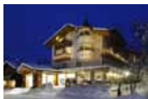
HOTEL ★★★★★ Concordia LIVIGNO Via Plan, 144 Tel. (+39) 0342 902 424