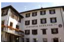
APPARTAMENTI Stelvio Bormio Via della Vittoria, 36 Tel. (+39) 0342 910130