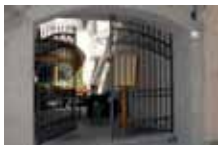
RISTORANTE PIZZERIA Contado BORMIO Via della Vittoria, 6 Tel. (+39) 0342 904 187