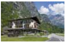
HOTEL ** Sasso Remenno VAL MASINO Via Zocca, 21 Tel. (+39) 0342 640 236