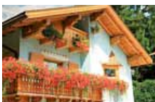
APPARTAMENTI Chalet Alfons BORMIO Via Angelo Moltrasio, 22 Tel. (+39) 0342 903524