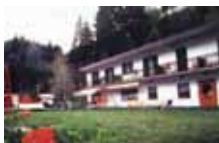
HOTEL ★★ Li Pineta Camping ISOLACCIA Via Le Runi, 16 Tel. (+39) 0342 985 365