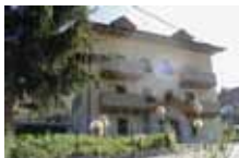
APPARTAMENTI Baita Canton SAN NICOLO' Via Mila, 11 Tel. (+39) 0342 945 444