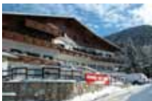
HOTEL *** Vallechiara CIUK Ciuk Tel. (+39) 0342 902.424