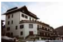
HOTEL ** La Montanara UZZA Via Uzza, 29 Tel. (+39) 0342 945 725