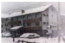
APPARTAMENTI Casa Ables SANT ANTONIO Via Sant Antonio, 4 Tel. (+39) 0342 945 758