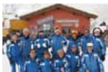
SCUOLA SCI Contea BORMIO Via Btg. Morbegno, 13 Tel. (+39) 0342 911 605