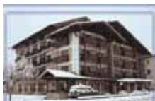
HOTEL *** Derby BORMIO Via Funiivia, 15 Tel. (+39) 0342 904.433