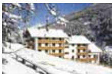
APPARTAMENTI Ortles Residence SANTA CATERINA Via Meralda, 19 Tel. (+39) 0342 935 353