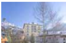
HOTEL ★★★ Muntanella ARDEZ Tel. (+39) 0342 902 424