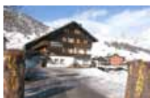
HOTEL ★★★ Alaska LIVIGNO Via Pontiglia, 173 Tel. (+39) 0342 970 796