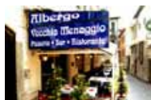
HOTEL * Vecchio Menaggio MENAGGIO Via al Lago 13 Tel. (+39) 0344 32082