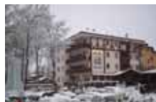
HOTEL **** Miramonti Park BORMIO Via Milano, 50 Tel (+39) 0342 902.424