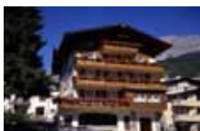
HOTEL ★★★ Contea Garni BORMIO Via Molini, 8 Tel. (+39) 0342 901 202