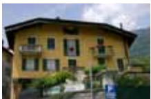
HOTEL * Coppa DAZIO Via Fiori, 8 Tel. (+39) 0342 65 01 56