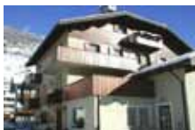
HOTEL *** I Rododendri SANT ANTONIO Via Sant Antonio, 2 Tel. (+39) 0342 945 666