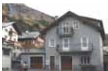
APPARTAMENTI Casa Cola PREMADIO Via Ripa Fontana, 3 Tel. (+39) 0342 997 428