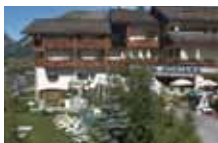
HOTEL ★★★★★ Baïta Montana LIVIGNO Via Mont dala Nef, 87 Tel. (+39) 0342 990 611