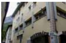
APPARTAMENTI Appartamento Marco BORMIO Via Trento, 2 Tel. (+39) 0342 90 21 16