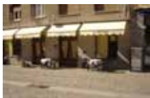
HOTEL★ Gusmeroli TIRANO Piazza Cavour, 5 Tel. (+39) 0342 902 424