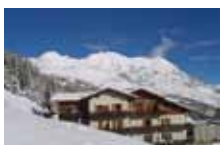
HOTEL ★★★ Rosalpina Meublè SEMOGO Via San Carlo, 16 Tel. (+39) 0342 927 141