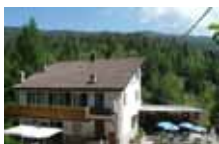
HOTEL★ Le Betulle APRICA Via Monte Padrio, 4 Tel. (+39) 0342 746 591