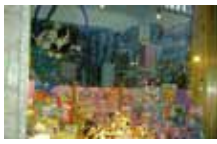
GIOCATTOLI Biancaneve BORMIO Via Milano, 3 Tel. (+39) 0342 901 606