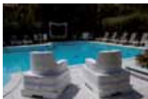
HOTEL **** Logos Hotel FORTE DEI MARMI Via Mazzini 153 Tel. (+39) 0584.880678