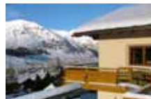
HOTEL ★★ Del Bosco Garni LIVIGNO Via Teola, 160 Tel. (+39) 0342 996 780