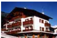
HOTEL *** Iris Residence Meublè CEPINA Via Roma, 58a Tel. (+39) 0342 950 439