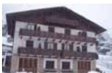
APPARTAMENTI Casa La Fontana 2 PREMADIO Via Cancano, 10 Tel. (+39) 0342 929 342