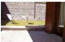
APPARTAMENTI STELLA ALPINA SANTA CATERINA Via Vedich Tel. (+39) 0342 945 758