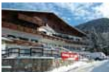
HOTEL *** Vallechiara CIUK Ciuk Tel. (+39) 0342 904 381