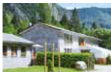
CAMPEGGIO *** Campeggio Sasso Remenno VAL MASINO Loc. Sasso Remenno