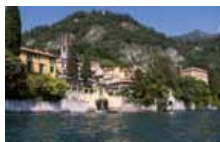
HOTEL **** Royal Hotel Victoria VARENNA Piazza San Giorgio, 2 Tel. (+39) 0341 815.111