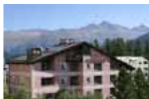
HOTEL ★★★★★ Cervus ST. MORITZ Tel. 0041 (0)81 38 50 000