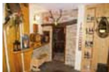
RISTORANTI Keller Steak House BORMIO Via Funivia, 32 Tel. (+39) 331 244 75 55