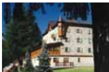
HOTEL *** Li Arnoga ARNOGA Via SS 301 Tel. (+39) 0342 927 116