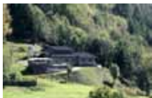
AGRITURISMO Li Spondi APRICA Loc. Li Spondi Tel. (+39) 339 19 24 482