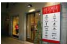
ARTICOLI SPORTIVI bimbi Sertorelli Sport BORMIO Via Roma, 51 Tel. (+39) 0342 903 060