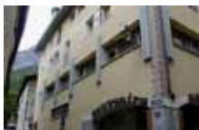
APPARTAMENTI Appartamento Marco BORMIO Via Trento, 2 Tel. (+39) 0342 90 21 16