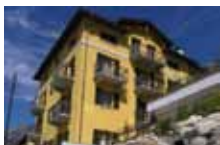
HOTEL *** Sertorelli Reit Meublè BORMIO Via San Carlo, 4 Tel. (+39) 0342 910 820