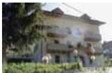
APPARTAMENTI Baita Canton SAN NICOLÒ' Via Mila, 11 Tel. (+39) 0342 945 444