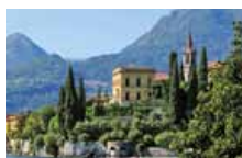
BED & BREAKFAST Il Bolentino VARENNA Via Venini, 156 Tel. (+39) 347 74.53.559