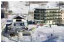
HOTEL ★★★ Hotel Club Funivia APRICA P.le Funivia Baradello Tel. (+39) 0342 746 230