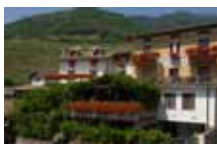
HOTEL ★ Locanda Altavilla BIANZONE Via Ai Monti, 46 Tel. (+39) 0342 720 355