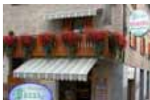
PASTICCERIA Pozzi Pasticceria BORMIO Via IV Novembre, 4 Tel. (+39) 0342 901 492