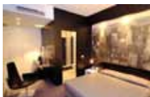
SUITES Le suites di Tirano TIRANO Viale Italia Tel. (+39) 0342 701 302