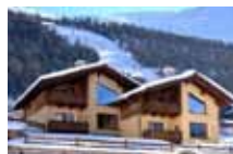
APPARTAMENTI Chalet Garden LIVIGNO Via SS301, 708 Tel. (+39) 0342 970 310