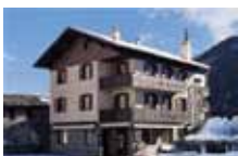
APPARTAMENTI Casa Viola ISOLACCIA Piazza IV Novembre, 16 Tel. (+39) 0342 921 113