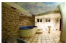
WELLNESS Mabel BORMIO Via Funivie Tel. (+39) 0342 901 510