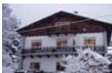
APPARTAMENTI Casa La Fontana PREMADIO Via Cancano, 2 Tel. (+39) 0342 929 342