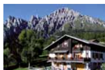
BED & BREAKFAST Ai Frassini ABBADIA LARIANA Via dei Frassini, 9 Tel. (+39) 0341 590.022