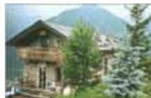
AGRITURISMO Baita del Gufo GROSOTTO Via Mortirolo, 16 Tel. (+39) 338 64 13 831