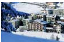
HOTEL *** Miravalle SEMOGO Piazza Sant Abbondio, 3 Tel. (+39) 0342 985 264