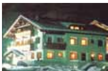
HOTEL ** Gardenia ISOLACCIA Via Ai Piani, 6 Tel. (+39) 0342 985 563