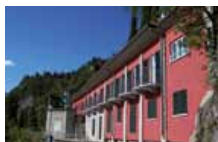
HOTEL *** Eremo Gaudio VARENNA Via Roma, 25 Tel. (+39) 0341 815.301