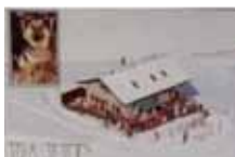
RIFUGIO - RISTORO Palù SANTA CATERINA Località Plagheira Tel. (+39) 0342 925 030