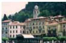
HOTEL *** Du Lac BELLAGIO Piazza Mazzini 32 Tel. (+39) 031 950320