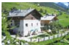
AGRITURISMO Raethia Loc. Pedenosso - VALDIDENTRO via S. Antonio, 1 tel. 0342.986134