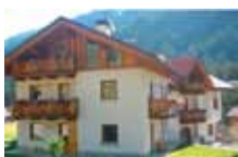
APPARTAMENTI Chalet La Rugiada VALDISOTTO Via Roma, 82/b Tel. (+39) 0342 951 151