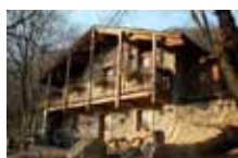
AGRITURISMO La Nughera CIVO Frazione Cadelsasso Tel. (+39) 347 15 67 054