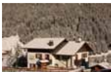
APPARTAMENTI Chalet Bucaneve SANTA CATERINA Via Plagheira, 7 Tel. (+39) 0342 925 086