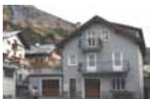
APPARTAMENTI Casa Cola PREMADIO Via Ripa Fontana, 3 Tel. (+39) 0342 997 428