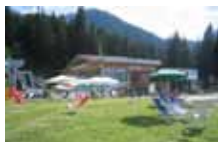
RISTORO Paso APRICA Loc. Palabione Tel. (+39) 0342 745 065