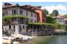
HOTEL ** La Pergola BELLAGIO Piazza del Porto 4 Tel. (+39) 031 950263