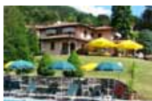
HOTEL *** Royal MENAGGIO L.go V. Veneto 91 Tel. (+39) 0344 31444