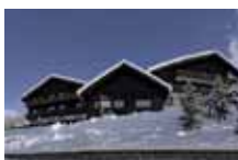
HOTEL *** Alexander LIVIGNO Via Freita, 103 Tel. (+39) 0342 996 550