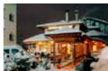
HOTEL *** Ambassador BORMIO Via Funiivia, 29 Tel. (+39) 0342 904.625