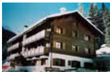
APPARTAMENTI Valfurva Residence SANTA CATERINA Via Magliaga, 44 Tel. (+39) 0342 935 500