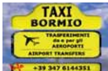
TAXI Taxi Bormio di Muscetti BORMIO Via Cacciatori delle Alpi, 23 Tel. (+39) 347 6144351