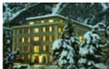
HOTEL ★★★ Bernina PONTRESINA Tel. +41 (0)81 838 86 86