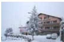
HOTEL ★★ Miravalle TEGLIO Via Roma, 70 Tel. (+39) 0342 780 154