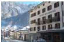
HOTEL *** Miramonti CHIESA IN VALMALENCO Via Rusca, 20 Tel. (+39) 0342 556 427