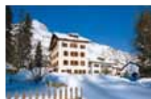
HOTEL ★★★ Privata SILS Tel. 0041 (0)81 83 26 200