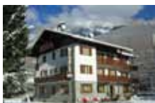
HOTEL *** Cima Bianca Meublè BORMIO Via Credaro, 5 Tel. (+39) 0342 901 449