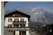
HOTEL ** Alpina PREMADIO Via San Gallo, 1 Tel. (+39) 0342 901 251