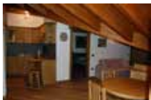
FALEGNAME Mobil Art BORMIO Via Sertorelli, 64 Tel. (+39) 0342 927 318