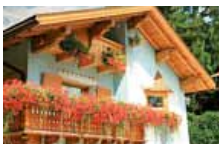
APPARTAMENTI Chalet Alfonz BORMIO Via Angelo Moltrasio, 22 Tel. (+39) 0342 903524