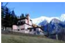
HOTEL *** Torre SONDALO Via Zubiani, 78 Tel. (+39) 0342 801 131