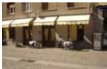
HOTEL★ Gusmeroli TIRANO Piazza Cavour, 5 Tel. (+39) 0342 701 338