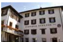
APPARTAMENTI Stelvio Bormio Via della Vittoria, 36 Tel. (+39) 0342 910130