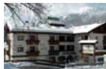
HOTEL **** Sant Anton BORMIO Via Leghe Grigie, 1 Tel. (+39) 0342 901 906