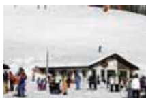
NOLEGGIO E RIPARAZIONE Noleggio Max LIVIGNO via Plan, 413 Tel. (+39) 0342 970 130