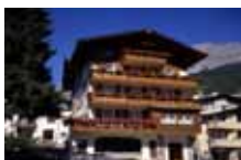
HOTEL *** Contea Garni BORMIO Via Molini, 8 Tel. (+39) 0342 901 202