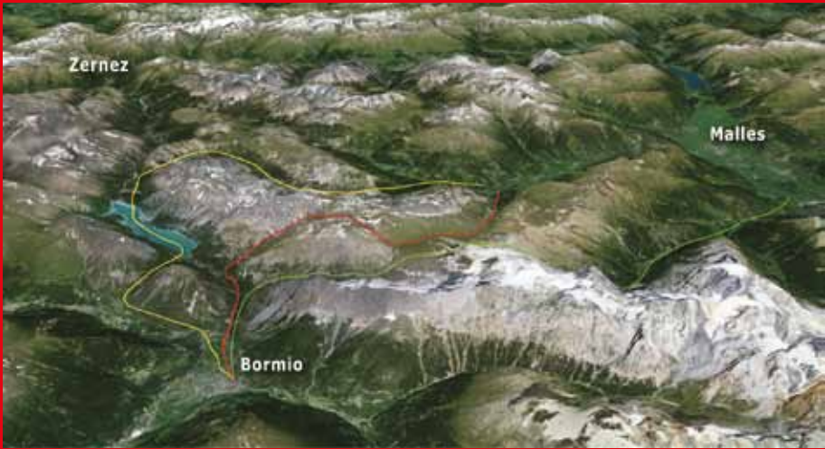
Gli antichi collegamenti: Via Imperiale, Strada dell'Umbrail, Strada dello Stelvio e, sotto, i relatori alla Tavola Rotonda del 9/11/2013