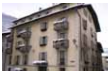
HOTEL ** Dante Meublè BORMIO Via Trieste, 2 Tel. (+39) 0342 901 329