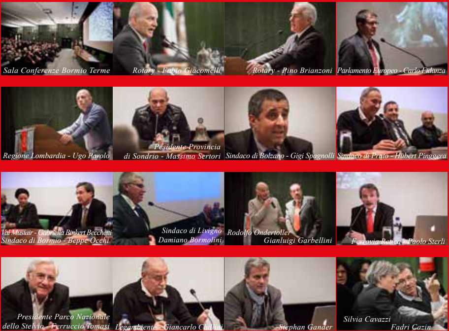
Sala Conferenze Bormio Terme