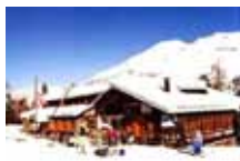
RIFUGIO - RISTORO Paradiso SANTA CATERINA Località Plagheira Tel. (+39) 0342 935 417