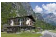
HOTEL ** Sasso Remenno VAL MASINO Via Zocca, 21 Tel. (+39) 0342 640 236