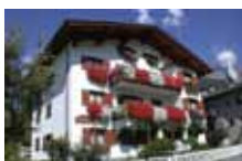
APPARTAMENTI Baita Diana BORMIO Via Sant Antonio, 12 Tel. (+39) 0342 903 793