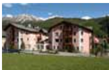
HOTEL ★★★ Garni Belvoir ZUOZ Tel. +41 (0)81 85 42 023