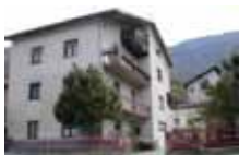
BED & BREAKFAST Stazzona B&B VILLA DI TIRANO Via Gianbonelli, 10 Tel. (+39) 0342 795 538