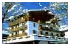
HOTEL *** Nazionale BORMIO Via Al Forte, 28 Tel. (+39) 0342 903 361