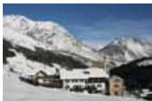
HOTEL *** Cardo SEMOGO Via Cima Piazzì, 80 Tel. (+39) 0342 927 171