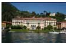
GRAND HOTEL ***** Menaggio MENAGGIO Via 4 Novembre 77 Tel. (+39) 0344 30640