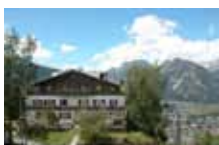
APPARTAMENTI Lo Chalet CIUK Ciuk Tel. (+39) 0342 904 381