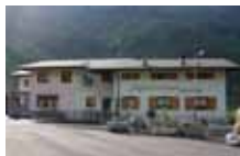
AGRITURISMO RISTORO Moon Café GROSIO TIOLE Via Stelvio, 152 Tel. (+39) 0342 803 215