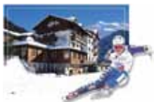
HOTEL **** Baita Fiorita SANTA CATERINA Via Frodolfo, 3 Tel. (+39) 0342 925 119