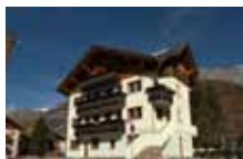
APPARTAMENTI Residence Pedranzini BORMIO Via Campioni Olimpici Tel. (+39) 339 11 02 533