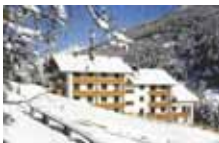
APPARTAMENTI Ortles Residence SANTA CATERINA Via Meralda, 19 Tel. (+39) 0342 935 353