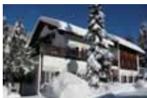
HOTEL ★★★ Engiadina FTAN Tel. +41 (0)81 864 04 34