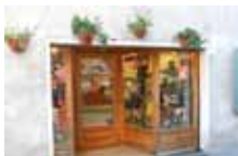
CALZATURE Giacomelli BORMIO Via Moltrasio, 1 Tel. (+39) 0342 903 566