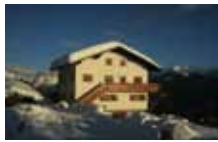
TRATTORIA RISTORO Cascina Biancotti VILLA DI TIRANO Loc. Pian di Gembro Tel. (+39) 0342 747 061