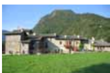
AGRITURISMO Le Case dei Baff ARDENNO MASINO Via Mulini, 19 Tel. (+39) 0342 661 045