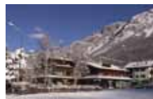
HOTEL *** Nevada BORMIO Via Btg. Morbegno, 21 Tel. (+39) 0342 910.888