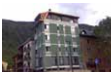
MEUBLE' ★★★ Stelvio TIRANO Lungo Adda IV Novembre, 1 Tel. (+39) 0342 701 044