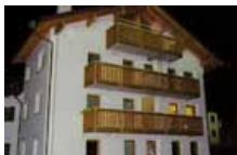
APPARTAMENTI Casa Betty BORMIO Via Funivia, 63/a Tel. (+39) 338 16 76 808