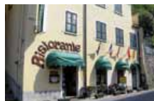
HOTEL *** Montecodeno VARENNA Via della Croce, 2 Tel. (+39) 0341 830.123