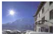
HOTEL ★★★ Eden ST. MORITZ Tel. +41 (0)81 830 18 00