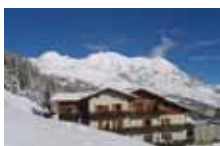
HOTEL *** Rosalpina Meublè SEMOGO Via San Carlo, 16 Tel. (+39) 0342 927 141