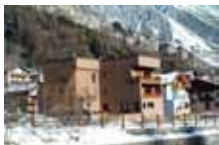
HOTEL *** La Val ISOLACCIA Via Presura, 7 Tel. (+39) 0342 985 519