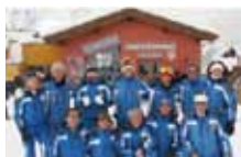
SCUOLA SCI Contea BORMIO Via Btg. Morbegno, 13 Tel. (+39) 0342 911 605