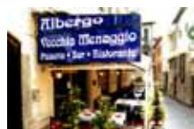
HOTEL * Vecchio Menaggio MENAGGIO Via al Lago 13 Tel. (+39) 0344 32082