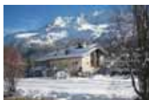
HOTEL ★★★ Chesa Grischa SILS Tel. +41 (0)81 826 51 16