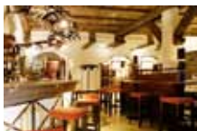
RIFUGIO-RISTORO Gallo Cedrone VALDISOTTO Loc. Bormio 2000 Tel. (+39) 0342 902 317