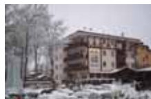
HOTEL **** Miramonti Park BORMIO Via Milano, 50 Tel. (+39) 0342 903 312