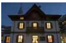
HOTEL Relais Villa Brioschi APRICA Via Valeriana Tel. (+39) 0342 745 681