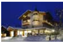
HOTEL **** Concordia LIVIGNO Via Plan, 144 Tel. (+39) 0342 990 100