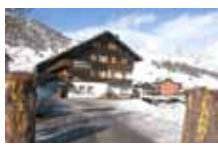
HOTEL *** Alaska LIVIGNO Via Pontiglia, 173 Tel. (+39) 0342 970 796