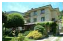
BED & BREAKFAST B&B Villa Verde GROSIO via Pineta, 2 Tel. (+39) 0342 847 594