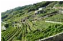
CASA VINICOLA Nera CHIURO Via IV Novembre, 43 Tel. (+39) 0342 482 631