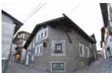
APPARTAMENTI Chalet Cotril BORMIO Via Dante, 6 Tel. (+39) 335 55 53 68