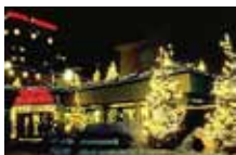
HOTEL ★★★★★ Europa ST. MORITZ Tel. +41 (0)81 839 55 55