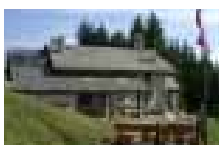
RIFUGIO Rifugio della Corte VALGEROLA Loc. La Corte Tel. (+39) 338 846 3479