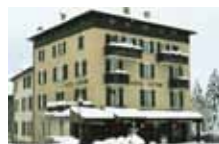
HOTEL *** Capitani BORMIO Via Milano, 23 Tel. (+39) 0342 905.300