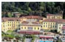
GRAND HOTEL ***** Villa Serbelloni BELLAGIO Via Roma 1 Tel. (+39) 031 950216