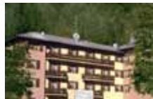
APPARTAMENTI Stella Alpina APRICA Corso Roma, 3 Tel. (+39) 0342 748 010