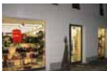
PROFUMERIA Soleil BORMIO Via Roma, 10 Tel. (+39) 0342 903 328