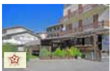
RISTORANTE PIZZERIA Al Castello Teglio Via Besta, 10 Tel. (+39) 0342 780 305