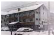
APPARTAMENTI Casa Ables SANT ANTONIO Via Sant Antonio, 4 Tel. (+39) 0342 945 758