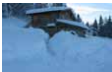
AGRITURISMO I Conti di Piscè VILLA DI TIRANO Loc. Pian di Gembro Tel. (+39) 0342 746 518