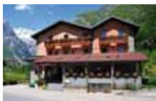
HOTEL *** Miramonti VAL MASINO Via Zocca, 12 Tel. (+39) 0342 64 01 44