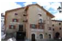
HOTEL ★★ Pensione Croce Bianca SAMEDAN Tel. +41 (0)81 852 53 53