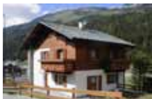
APPARTAMENTI Baita Cola SANTA CATERINA Via Plagheira, 5b Tel. (+39) 0342 997 293