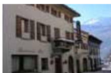
HOTEL **** Silene BORMIO Via Roma, 121 Tel. (+39) 0342 905.455