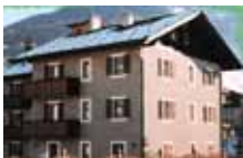
APPARTAMENTI Casa Lucia BORMIO Via Molini, 11 Tel. (+39) 0342 904 433