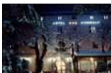
HOTEL ★★★ Combolo TEGLIO Via Roma, 5 Tel. (+39) 0342 780 083