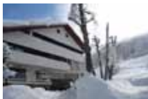
HOTEL ★★★ Cioccarelli APRICA Via Adamello, 10 Tel. (+39) 0342 746 019