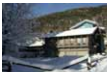
HOTEL ★★★ Saint Martin APRICA Via Europa, 18 Tel. (+39) 0342 748 052