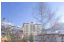
HOTEL ★★★ Muntanella ARDEZ Tel. +41 (0)81 861 00 33