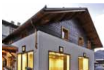
ABBIGLIAMENTO Renna Sport Bags LIVIGNO Via Bondi, 29 Tel. (+39) 0342 990 151