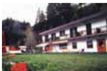
HOTEL ** La Pineta Camping ISOLACCIA Via Le Runi, 16 Tel. (+39) 0342 985 365