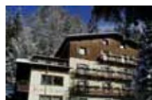
HOTEL ** Daniela BORMIO Via Monte Cristallo, 21 Tel. (+39) 0342 904 572