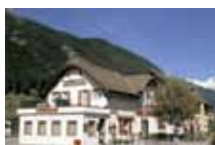
HOTEL ★★★ A La Staziun ZERNEZ Tel. +41 (0)81 856 11 26